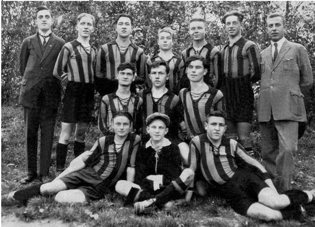
Die A-Jugend der Olympia, die Gau-Jugendmeister 1925 wurde.

1923 war eine Jugendfußball-Abteilung gegründet worden, die sehr erfolgreich war, und aus der später viele gute Kräfte in die 1. Mannschaft hineinwuchsen. Die Jugendfußballer erkämpften mehrere Meisterschaften, sie trugen Spiele gegen die Frankfurter Eintracht, die Stuttgarter Kickers und den VfR Mannheim aus, traten in Wiesbaden, Darmstadt und Worms an. Die A-Jugend des Sportclubs „Olympia“ wurde 1925 Gau-Jugendmeister.